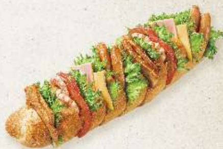
フランスパンサンド(アラカルト) 3~4人用 ¥1,700(税込)