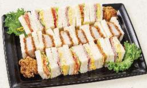
ひれカツミックスオードブル 3~4人用 ¥1,800(税込)