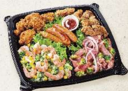
デリカオードブル 4~5人用 ¥2,600(税込)

※価格は全てテイクアウト価格です。※店舗により一部取り扱っていない商品もございます。 ※都合により一部変更になる場合がございます。予めご了承ください。