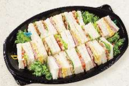
プリティーオードブル 2~3人用 ¥1,400(税込)