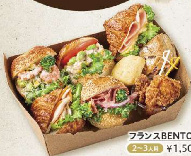
フランスBENTO(アミ) 2~3人用 ¥1,500(税込)