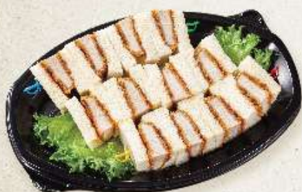
カツサンドオードブル 2~3人用 ¥1,800(税込)