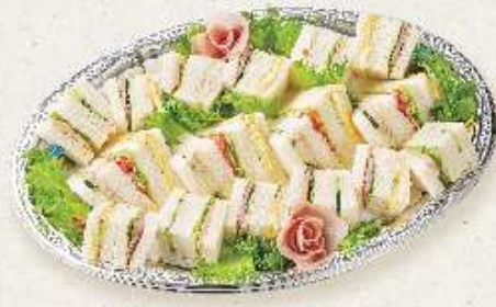
サンドイッチオードブル 4~5人用 ¥2,700(税込)