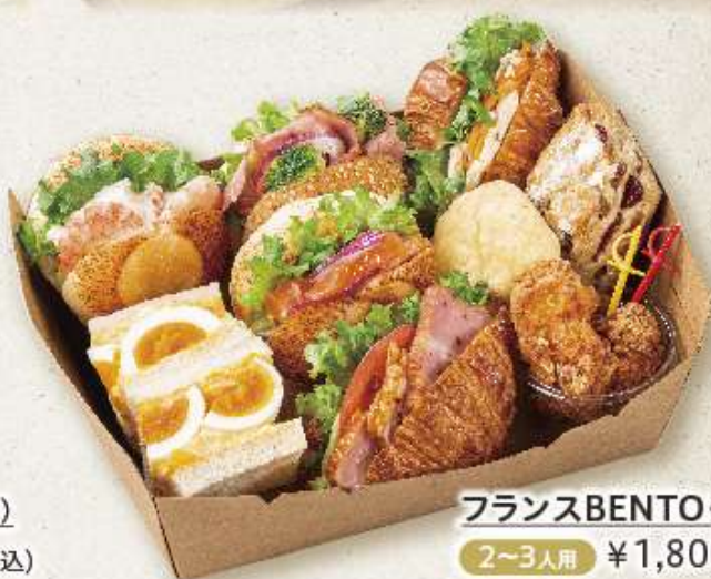
フランスBENTO(コパン) 2~3人用 ¥1,800(税込)